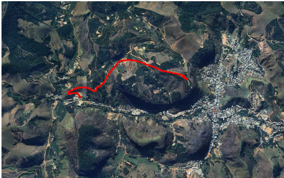
CROQUI DE LOCALIZAÇÃO: IMAGEM PANORÂMICA DO LOCAL VIA SOFTWARE GOOGLE EARTH

COORDENADAS: LATITUDE: -30°08'00.93" LONGITUDE: -47°38'04.61"